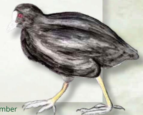
Tekeningen: Paul, Amber