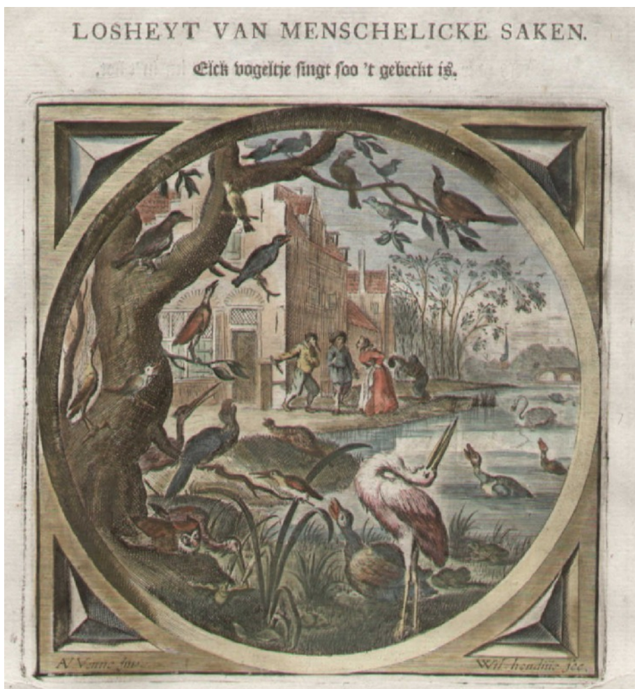
Embleem bij spreuk van Jacob Cats: Elk vogeltje zingt zoals het gebekt is. Origineel zit waarschijnlijk in collectie Dordrechts Museum